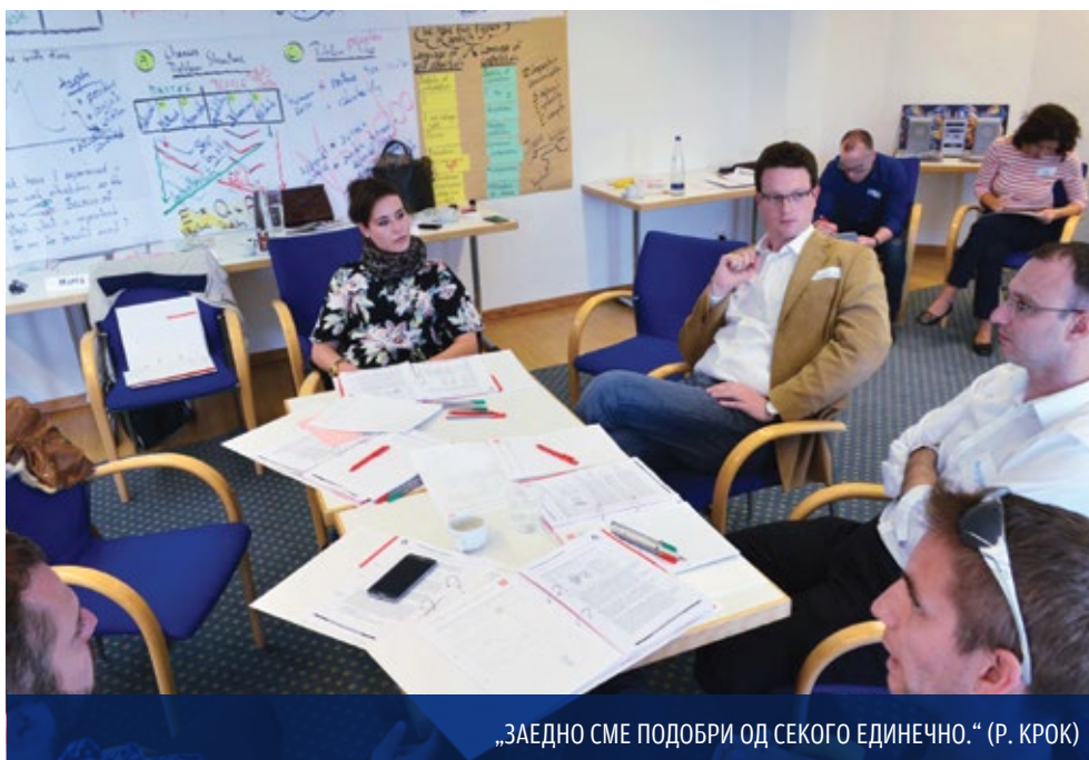
„ЗАЕДНО СМЕ ПОДОБРИ ОД СЕКОГО ЕДИНЕЧНО.“ (Р. КРОК)