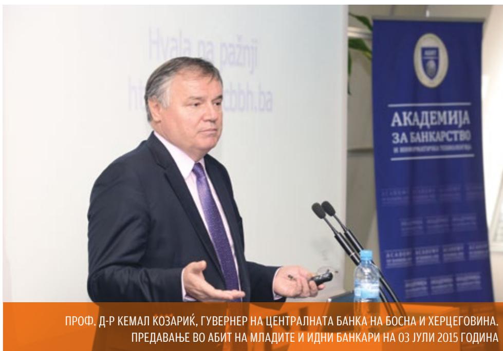
ПРОФ. Д-Р КЕМАЛ КОЗАРИЌ, ГУВЕРНЕР НА ЦЕНТРАЛНАТА БАНКА НА БОСНА И ХЕРЦЕГОВИНА. ПРЕДАВАЊЕ ВО АБИТ НА МЛАДИТЕ И ИДНИ БАНКАРИ НА 03 ЈУЛИ 2015 ГОДИНА